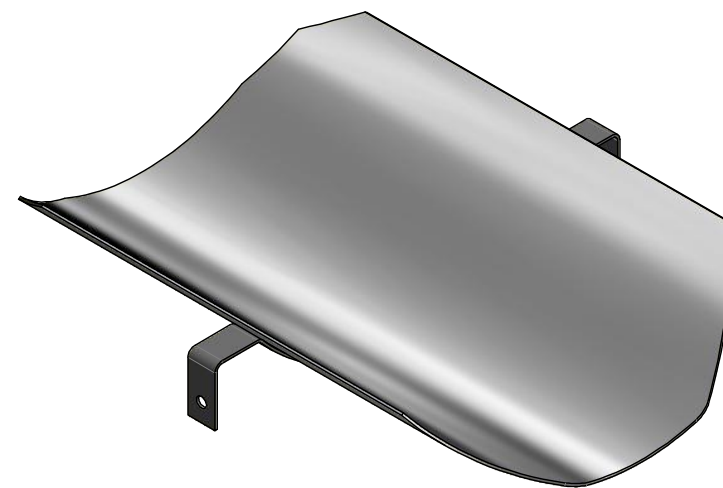
"VISTA ISOMETRICA" Escala: 1 : 7.5